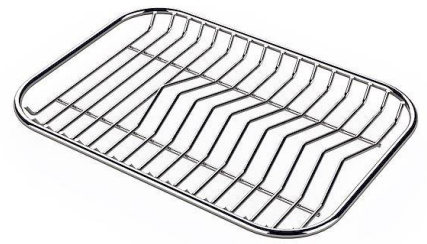
Rejilla portaplatos inox 8100 154