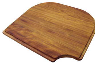
Tabla de corte de madera Iroko 8659 111