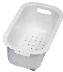
escurre pasta blanco 8151 100