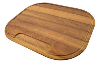
Tabla de corte de madera Iroko 8659 112