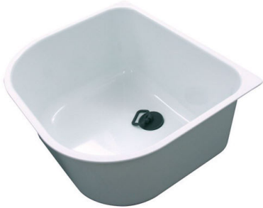
Cubeta blanca 8152 100